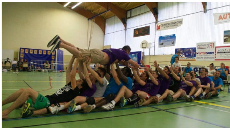
Ambiance conviviale, notamment lors des Fiso et autres événements

Il se pratique essentiellement en salle, donc, n'est pas soumis aux aléas de la météo. En intérieur, les actions de communication se réalisent plus confortablement; les équipements sont plus aisément préservés. Une ambiance chaleureuse et conviviale se crée dans la salle.